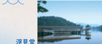
遊覧船乗り場 かんざんじ港